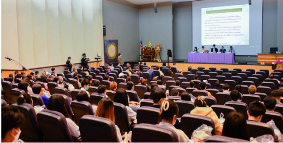
มมส ประชุมรับฟังความคิดเห็นที่มีต่อ (ร่าง) พระราชบัญญัติฯ เตรียมเป็น ม.ในกำกับของรัฐ (ครั้งที่ 4)